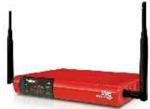
X10e-W, X20e-W, X55e-W