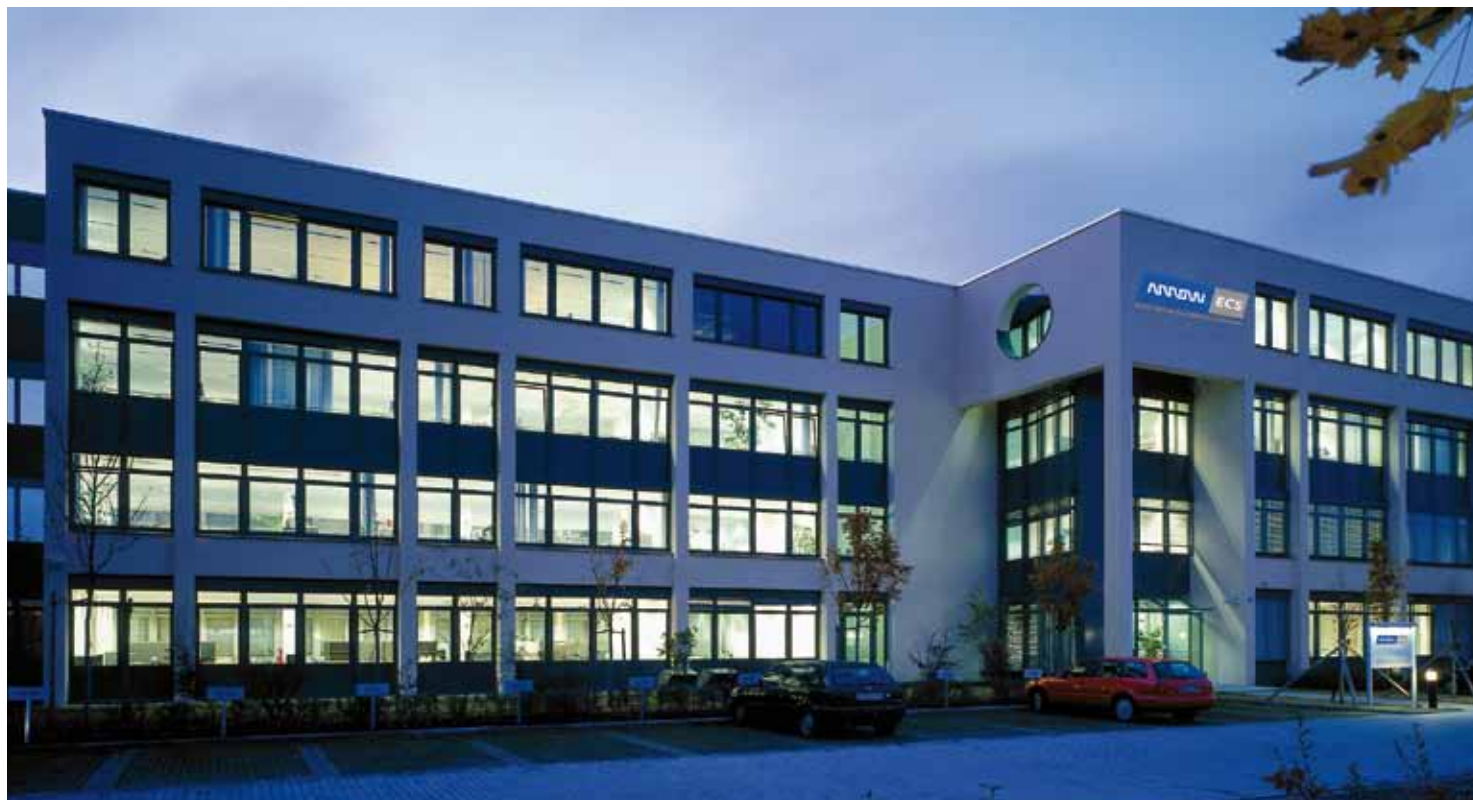
Arrow ECS in Fürstenfeldbruck

Mehr Informationen finden Sie unter www.arrowecs.de